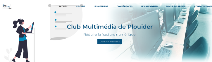
Le Club Multimédia de Plouider

Le Club Multimédia de Plouider a été créé en 2009 par des élus et de bénévoles dans le but de réduire la fracture numérique et aujourd'hui l'illectronisme. C'est une association Loi 1901 déclarée à la sous-Préfecture de Brest.